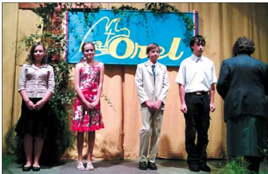
18. ročník SVATOVÁCLVSKÁ RÉVA v KD v Lubině