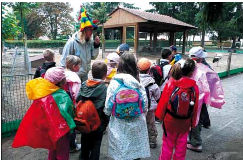
1. třída v ZOOparku