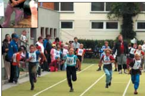
Soutěž v lehké atletice o odznak Bedřicha Kostelky ve Vyškově