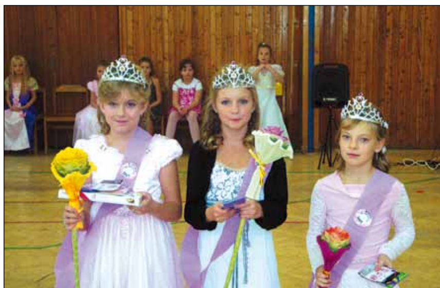
MISS školní družiny