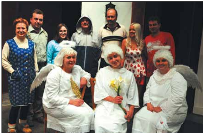
Postel pro anděla