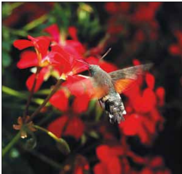
“Balet na rudým kalichem” první místo v kategorii “Makro”.