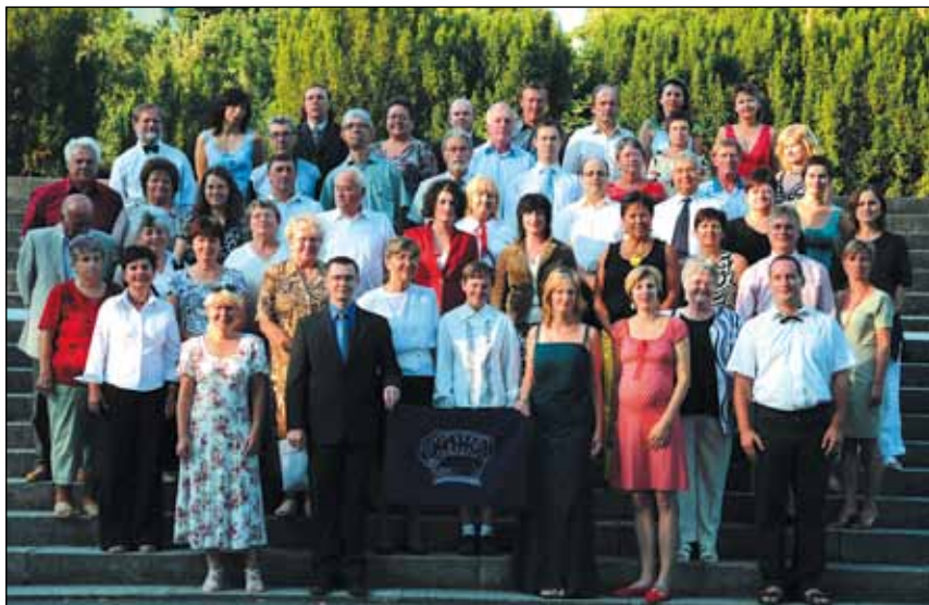
Část členské základny Drnky v srpnu 2009.