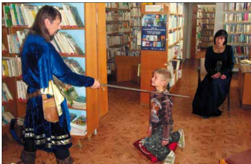
Pasování na čtenáře