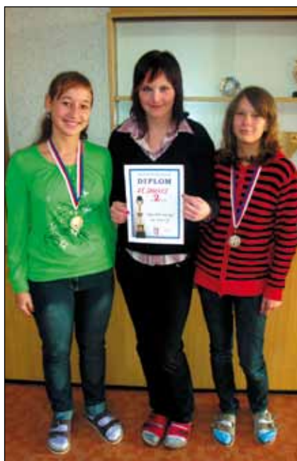
Stolní tenis - dívky